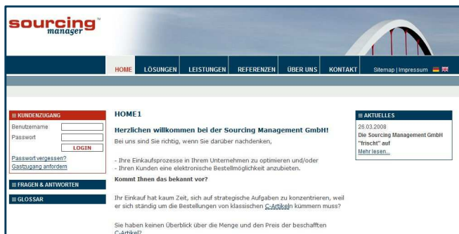
Abb. 1 Der neue Internet-Auftritt geht nach Ostern online.

Den geschlossenen Benutzerbereich erreichen Sie über das Anmeldeformular auf der linken Seite. Wie gewohnt, hinterlegen Sie hier Ihren Benutzernamen und Ihr Passwort und klicken auf „login“. Nach der erfolgreichen Anmeldung werden Sie in Ihren geschlossenen Bereich weiter geleitet. Beim der Anmeldevorgang bleibt also alles beim Alten.