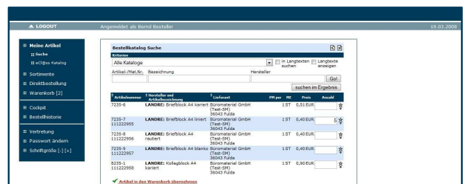
Abb. 2 Der Benutzerbereich im neuen Gewand

In Ihrem Benutzerbereich ändert sich bis auf das neue Design ebenfalls nichts. Die Funktionalitäten bleiben wie gewohnt erhalten. Sie müssen sich in der Bedienung also nicht umstellen. Sie sehen, bei dem neuen Auftritt geht es zurzeit nur um „Äußerlichkeiten“.